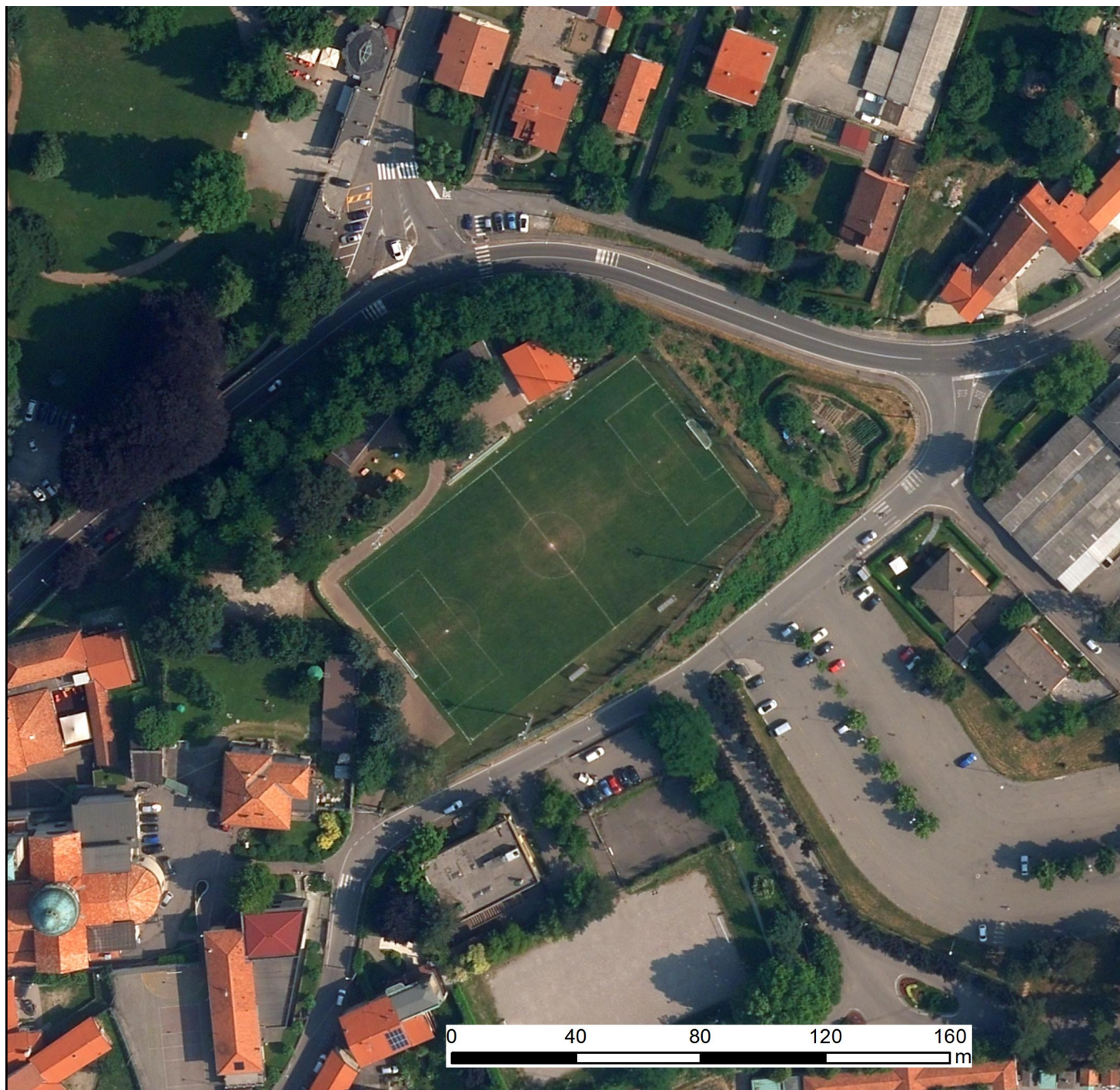
Ortofoto 2015