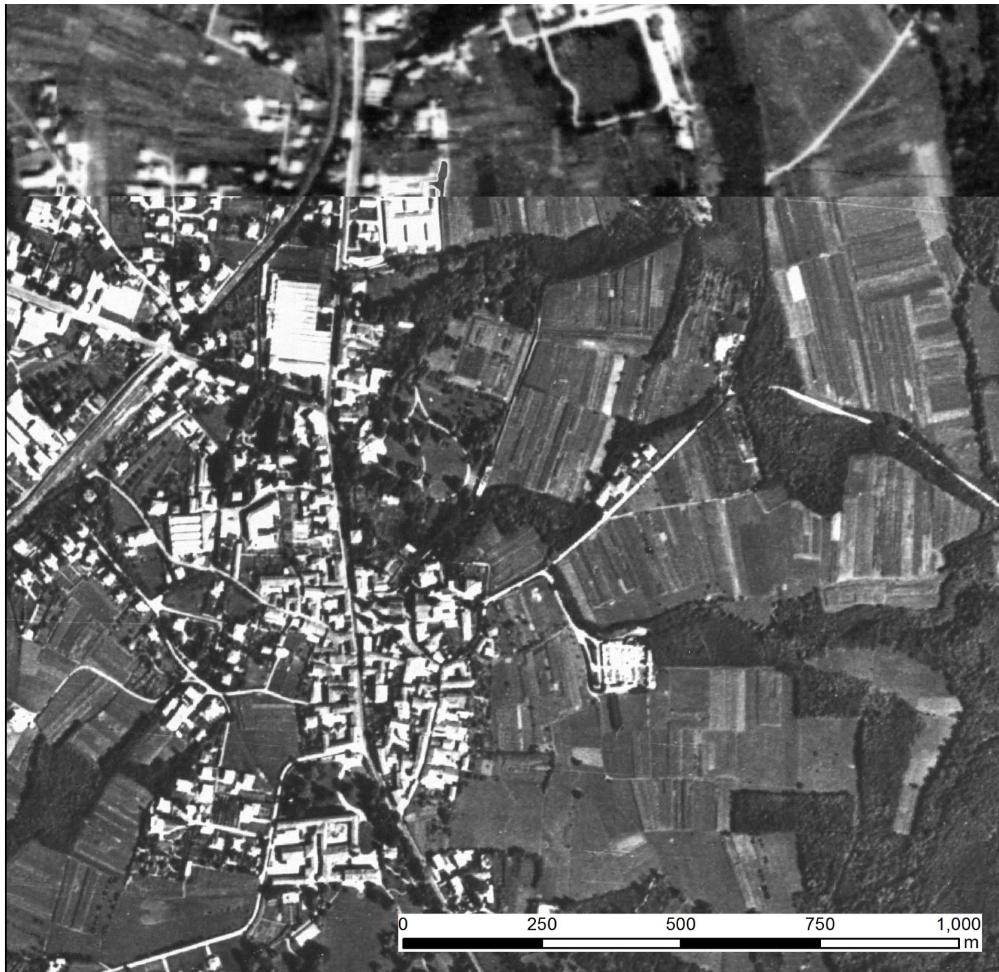
Immagine mosaicata delle foto Aeree Volo GAI (Gruppo Aereo Italiano) 1954-55